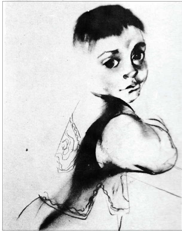
Д.Семенова Из путевых зарисовок по Афганистану 1985. Уголь

В Никарагуа я сделала композиционные рисунки, этюды, пятьдесят портретов. Материала много, хотя вначале работать было сложно. Каждый человек, которого я рисовала, хотел видеть свой характер, а не только внешнее сходство. Каждый человек — это неповторимый характер и порой настолько сложный, что с одного раза, конечно, «ухватить» своеобразие личности, неповторимость ее невозможно без проникновения в психологию, без знакомства со взглядами человека на мир. На это у меня попросту не было возможности. И все же у меня сложилось впечатление об общих чертах национального характера, о «коллективном» портрете никарагуанцев, так героически отстаивающих свое право самим решать свою судьбу.